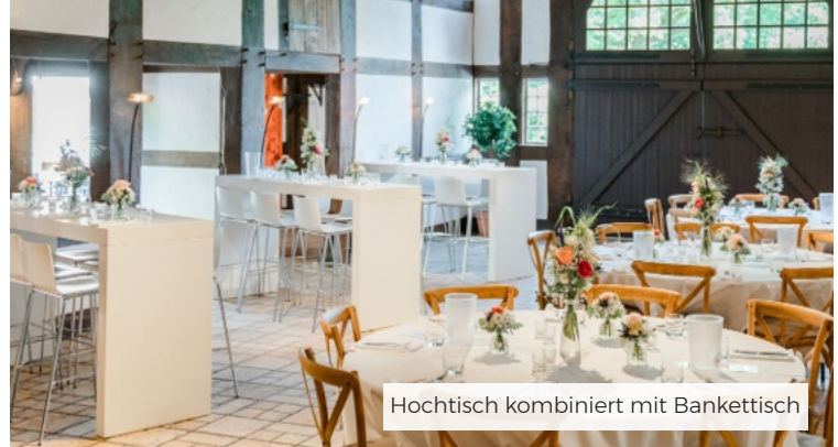
Hochtisch kombiniert mit Bankettisch