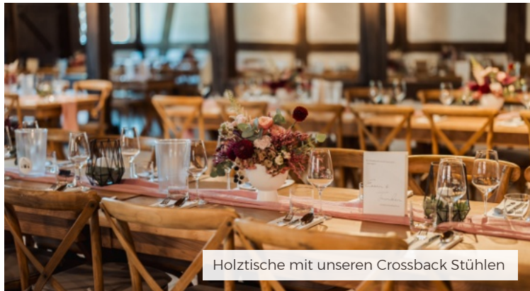
Holztische mit unseren Crossback Stühlen