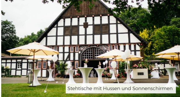
Stehtische mit Hussen und Sonnenschirmen

Hier erhalten Sie einen Einblick in unser Mietmobiliar. Eine weitere Auswahl finden Sie im Mietshop unter: www.derramselhof.de/mietshop